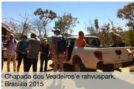
Chapada dos Veadeiros'e rahvuspark, Brasiilia 2015