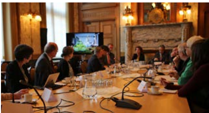
2015. aastal ülevaadet koostamas Rotterdamis (Madalmaad)